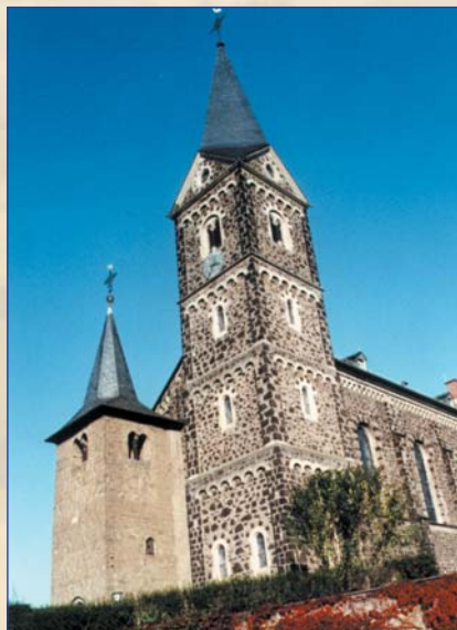
Die Kirche im Ortskern